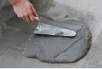
Harç mala yardımı ile yüzeye aktarılması