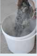
Harç suya eklenmesi