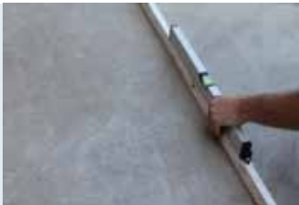
Yüzeyin düzgünlüğünün kontrol edilmesi