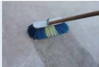
Yüzeyin temizlenip nemlendirilmesi