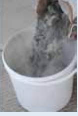
Harç suya eklenmesi