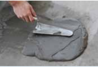
Harç mala yardımı ile yüzeye aktarılması