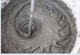
Karıştırıcı ile karıştırma