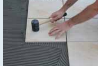
Çekiçle vurulup seviyelendirilmesi